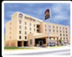
Hotel Best Western Valle Real

Personal que participa en las actividades de diseño, control, análisis, validación o mejora de procesos.